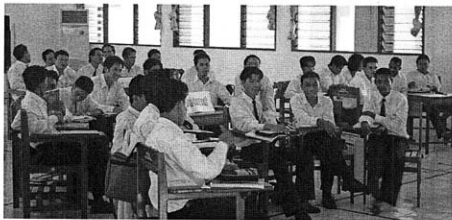
Mengajar di Bali / STT 'Johanes Calvin'