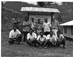
Groen di Pass Valley, Papua

Sudah sejak tahun 80-an GGRI-Papua mempunyai relasi yang baik dengan Gereja Jemaat Protestan di Indonesia (GJPI), yang lahir dari pekabaran Zending Gereformeerde Gemeenten di Belanda. Gereja-gereja ini terletak di pegunungan Papua. Berdasarkan relasi yang ada dengan GGRI, Litindo pun mencari hubungan dengan GJPI, dan ternyata diteri-