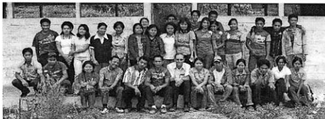
Litindo di Sekolah Teologia GTM / Sulawesi Barat

Agen Litindo: Toko Buku GTM di Mamasa, Sulawesi Barat