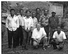
Riemer di Papua

GGRI lahir di Papua di pedalaman bagian Selatan, artinya di wilayah ketiga aliran sungai Digul, Mapi-Manggundo dan Ndeiram-Zürüt. Sebenarnya gereja-gereja ini dapat dipandang sebagai tempat asal Litindo, karena sinode GGRI-P pada tahun 1991 sudah memohon gereja-gereja di Belanda untuk memperbantukan berbagai penerjemah dan pengarang bagi penerbitan buku-buku dalam bahasa Indonesia. Pada waktu itu Sekolah Teologia Menengah 'Pelita' di