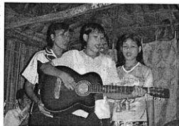
Memuji Tuhan di pulau Rote

Sudah sejak tahun 80-an GGRI-Papua mempunyai relasi yang baik dengan Gereja Jemaat Protestan di Indonesia (GJPI), yang lahir dari pekabaran Zending Gereformeerde Gemeenten di Belanda. Gereja-gereja ini terletak di pegunungan Papua. Berdasarkan relasi yang ada dengan GGRI, Litindo pun mencari hubungan dengan GJPI, dan ternyata diteri-