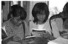
Litindo di Ambon

Agen Litindo: Perpustakaan STT BNKP Sundermann, Gunungsitoli, Nias