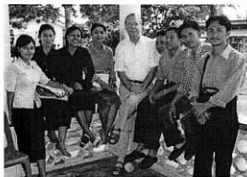
Venema di Nias

Sekitar 90% orang Nias termasuk agama Kristen Protestan (terutama: Luteran). Gereja terbesar adalah Banua Nih Keriso Protestan (BNKP, Gereja Kristen Protestan Nias). Kebanyakan gereja itu tentunya di Nias sendiri, tetapi ada juga sejumlah BNKP di diaspora, a.l. di Jakarta. Oleh karena tsunami dan gempa bumi, banyak gedung gereja habis lenyap. Juga banyak perpustakaan gereja rusak. Atas permohonan Ketua Sinode BNKP, Litindo memberi sumbangan dalam bentuk buku: kurang lebih 180 set Seri Pembina