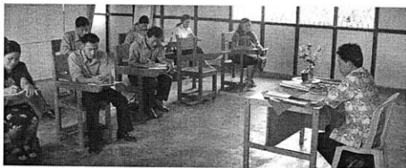
Kuliah di cabang Setia, Ngabang, KalBar