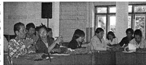
Seminar Indonesian Calvin Society di Rantepao

Karena letaknya Rantepao tidak terlalu jauh dari Mamasa, dan melihat latar belakang historis Gereja Toraja (GT), maka Litindo merasa diri terdorong untuk pergi ke Rantepao untuk memperkenalkan diri kepada GT, khususnya kepada STT di Rantepao. Ternyata inisiatif Litindo diterima dengan baik, dan sudah beberapa kali Litindo (dan CeriA) membuat atau mengikuti seminar di Rantepao. Sama seperti di Mamasa, di Rantepao pun dengan demikian sudah tumbuh suatu relasi kerjasama yang baik yang berdasarkan kesadaran bahwa bersama-sama kami berakar dalam ajaran Calvin. Pergaulan dengan pimpinan gereja dan STT selalu menggembirakan hati kami!