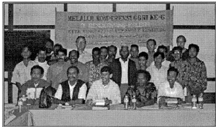
Konperensi GGRI di KalBar 1995