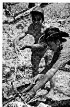
Bakar ayam di Pantai Sumba - lalu makan sama-sama

saya bawa ( Cermin Injil, Alkitab bukan teka-teki dan Jemaat yang hidup ) sangat menguatkan keyakinan saya bahwa proyek Litindo mulai berhasil. Saya menyebut di sini ucapan pdt. Mada Biha di Kupang: "Dengan buku-buku Litindo baru saya dapat memperlihatkan kepada pendeta-pendeta dari gereja-gereja lain apakah sebenarnya identitas Gereja-Gereja Reformasi."